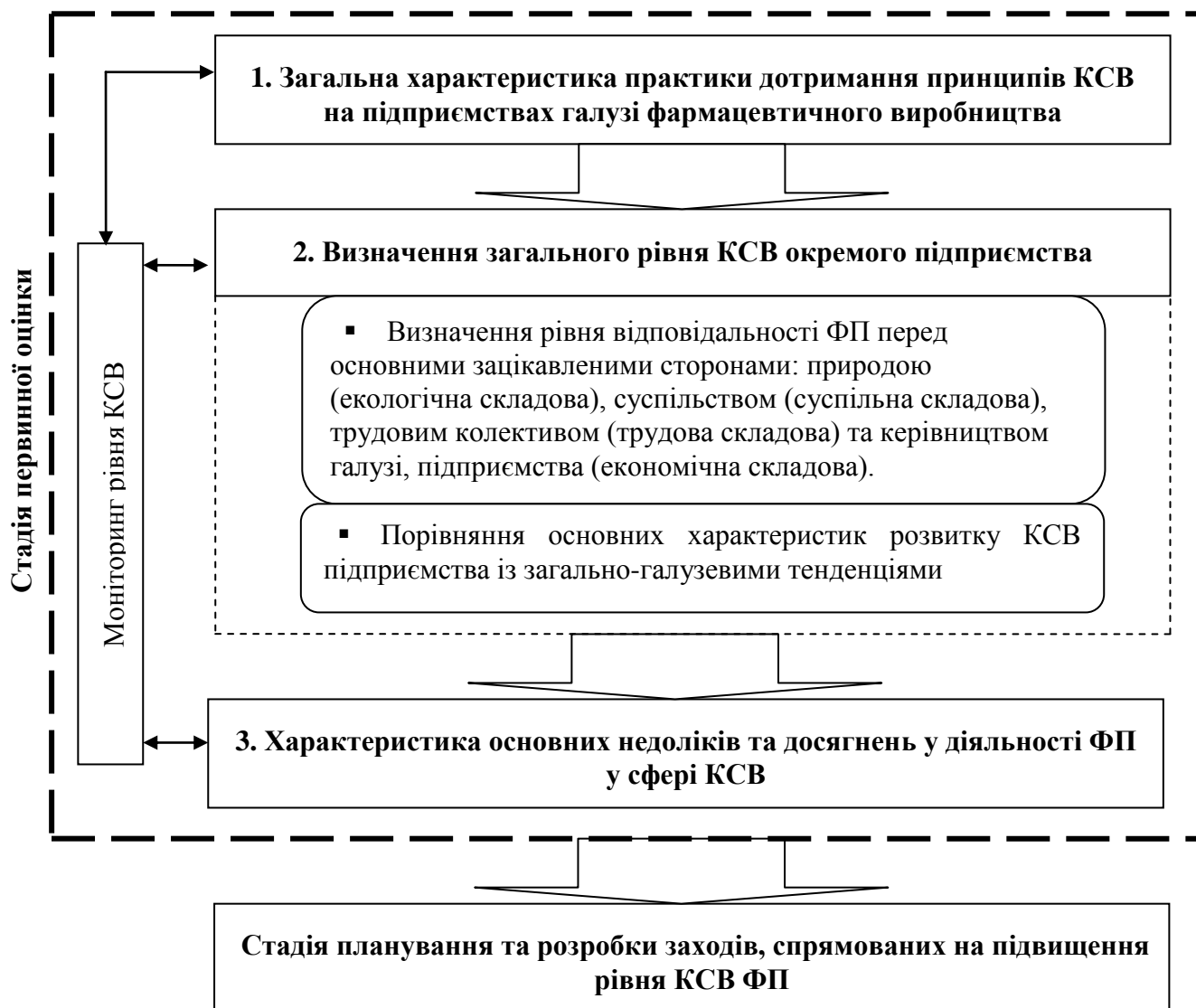
Рис. 3. Запропонована схема оцінки рівня КСВ ФП

2. Гадзевич О. І. Основи економічного аналізу і діагностики фінансово-господарської діяльності підприємств / О. І. Гадзевич. – К.: Кондор, 2004. – 180 с.